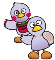
埼玉県マスコット 「さいたまっち」「コバトン」