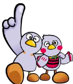
コバトン さいたまっち

さいたまっちは、平成 26 年 11 月 14 日(県民の日)に誕生したマスコット。「くりくりおめめ」と「お腹のボーダー」がトレードマーク。コバトンと一緒に埼玉県を全力でPRしています。