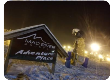
Mad river mountain スキー場

アメリカ人の友達と一緒に行ったのですが彼は全くスキーの経験がなく、一から教えました。英語で教えるのはとても大変でした。帰るころには中級者コースを転ぶことなく下れたので、苦勞してレクチャーした甲斐がありました。