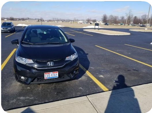
NBOからお借りしているFit

私事ですが2月に21歳の誕生日を迎えました。オハイオ州では21歳になると免許の更新が必要なため、半年ぶりに免許を更新しにBMV(Bureau of Motor Vehicles)へ行きました。書類さえそろえれば、少なくともオハイオ州では日本の免許からアメリカの免許にテストなど受けずに書き換えることができます。大金がかかるわけでもないため、もしアメリカに住む機会があったらトライすることをお勧めします！