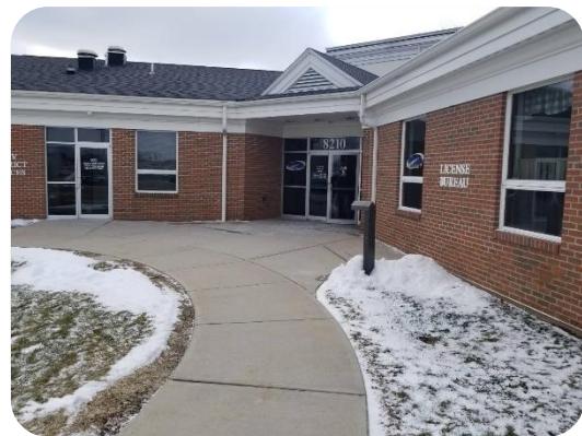
Ohio Bureau of Motor Vehicles