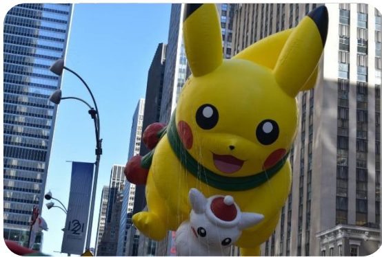
パレードに出現したピカチュウ

サンクスギビングの次の日はブラックフライデーです。ブラックフライデーの由来はセールにより売上げが伸びて結果として黒字になることらしいです。今では日本でもよく耳にするようになりましたよね。私は深夜2時ごろまで買い物を楽しんでホテルに戻ったのですが、その時間でさえもたくさんの人が買い物を続けていました。