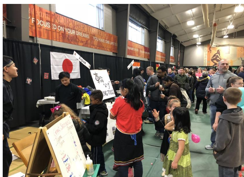
大人気の日本ブース！