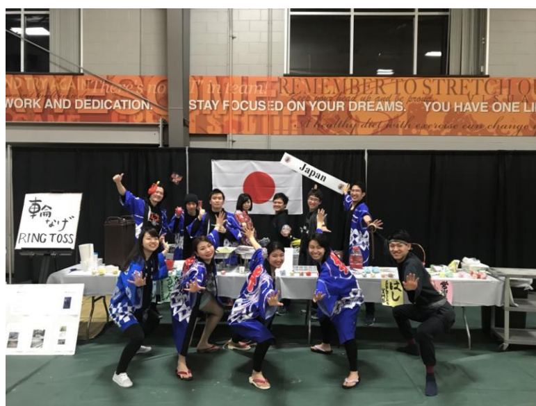
みんなではっぴを着て頑張りました！

た。この他にもヨーヨーすくいやお箸体験、輪投げなどのアクティビティが楽しめるブースを出展した他、日本人留学生 11 人でよさこいソーラン節を踊りました。日本ブースはとても人気で沢山の方に来ていただき、うどんやヨーヨーは全て売り切れに！よさこいソーラン節は簡単ではなく身体中が筋肉痛になってしまいましたが、踊り終わった後に大勢のお客さんが拍手をしてくれて筋肉痛の痛みも吹っ飛びました。