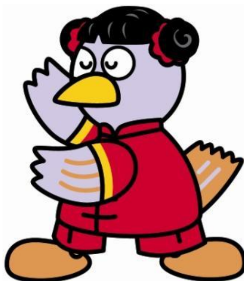
埼玉県のマスコット「コバトン」 (姉妹友好州省・山西省バージョン)