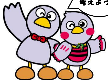
埼玉県のマスコット コバトンとさいたまっち

どこで、どのような支援が受けられるのか、同じ立場の方と交流したい、など情報提供をいたします。