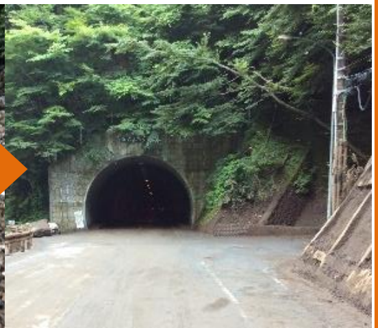
① 仏石山トンネル北側