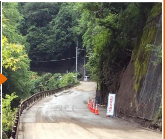
② 仏石山トンネル南側