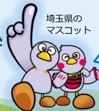
「コバトン」「さいたまっち」