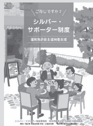
シルバー・サポーター制度 パンフレット