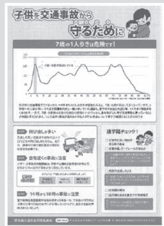
裏面 保護者向け 「子供を交通事故から守るために」▶