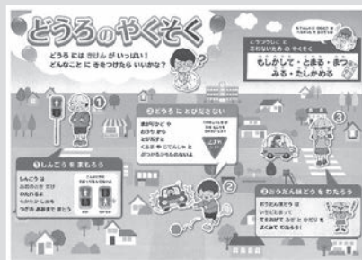
▲表面 児童向け 「どうろのやくそく」