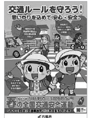
▲春の全国交通安全運動ポスター