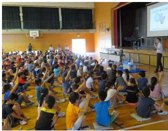
学校や職場にも出前します