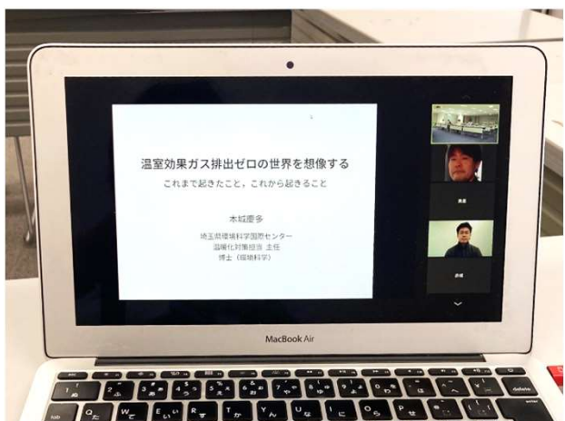
オンラインでの開催も ※担当課にご相談ください

埼玉県が取り組む事業や施策 を県職員が説明します。 集会や団体の会議、学校の授 業などにご活用ください。