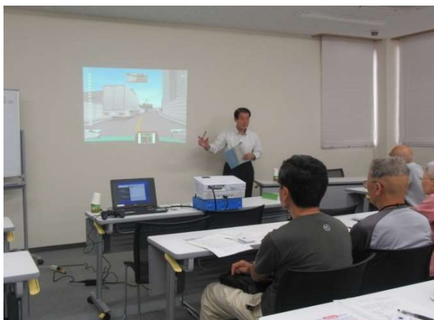
PTA や地域での勉強会などに