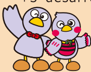
Mascota de Saitama 「Kobaton」 「saitamachi」

Si tiene alguna preocupación en cuanto al ingreso a la escuela primaria, por favor consulte al preescolar, jardín maternal, preescolar especial (Nintei kodomo en), o maestros de la primaria. La guía de crianza 「3 desarrollos」 sirve como referencia en el momento de hablar sobre la crianza de los niños.