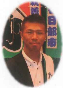
内山 高志さん WBA 世界 スーパーフェザー級 チャンピオン