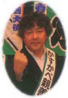
茂木 健一郎さん 脳科学者