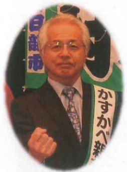
増村 紀一郎さん 漆芸家 重要無形文化財 (人間国宝)