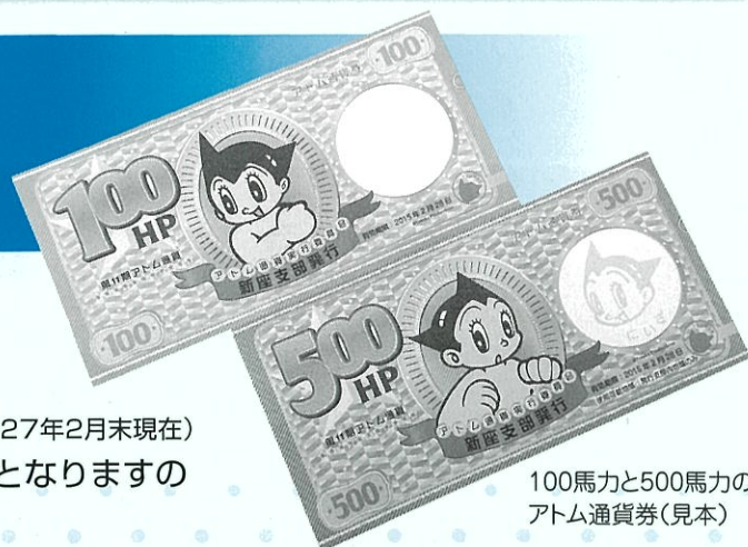
100馬力と500馬力の アトム通貨券（見本）

市内の加盟店（188店舗）で利用できます。（平成27年2月末現在） 使用できる期間は、4月7日から翌年2月末日までとなりますのでご注意ください。