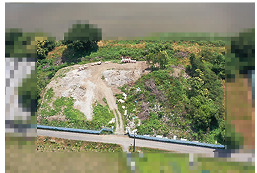
写真2-2 廃棄物の山のドローン撮影