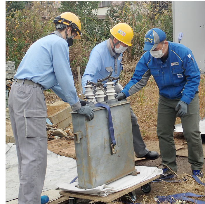
写真2-3 PCB廃棄物（PCB含有コンデンサー）の運搬処理

本県では、自ら処分場を確保することが困難な県内の市町村や中小企業者等のために、県直営の最終処分場として環境整備センターを整備し、平成元年2月から供用を開始しています。廃棄物の埋立に当たっては、厳しい管理基準を設定するなど環境保全対策に万