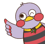
Saitamachi, la mascota de Saitama

La prefectura de Saitama cuenta con varios sistemas de apoyo económico para aquellos estudiantes que concurran a la secundaria superior, como un sistema de reducción de gastos y un sistema de préstamos sin interés. Para saber más detalles respecto a los sistemas y métodos de inscripción, por favor, consulte la tabla a continuación, y el interior y dorso de esta guía.