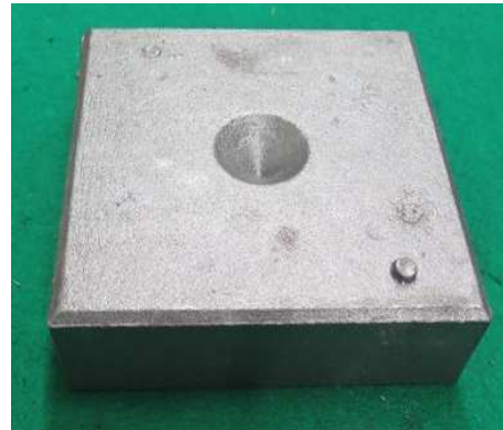
アッパーセンターブロック 裏面