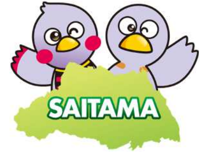
埼玉県マスコット 「さいたまっち」「コバトン」