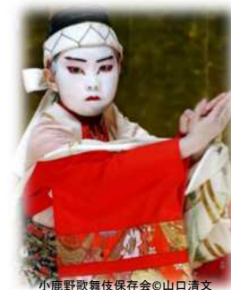
小鹿野歌舞伎保存会