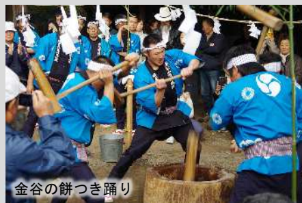
金谷の餅つき踊り

本県の文化総合ウェブサイトを運営しアーカイブ動画、イベント情報、支援企業等を紹介。