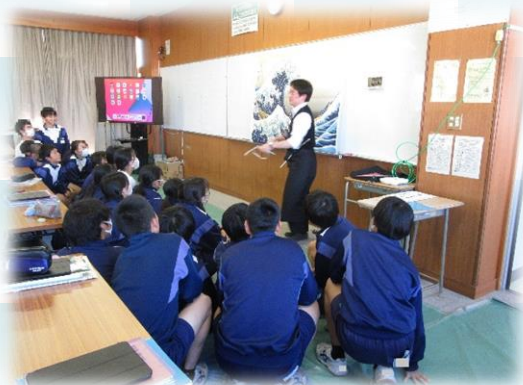
生徒を教室の前に集め、作品との出会いを楽しんでいる。