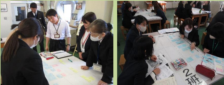
『私の授業の観てほしいポイント』に沿った研究協議