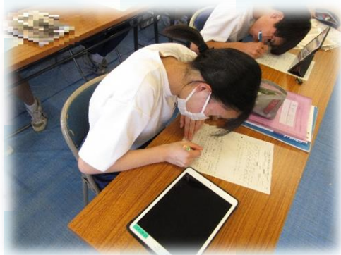
タブレットを活用し、詳細な画像を拡大しながら自分の考えをまとめている。