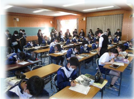
絵を見つめ、自分がどう感じたかを大切にしながら、ワークシートに書き込んでいる。