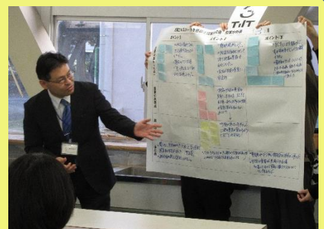
各班の協議内容の発表