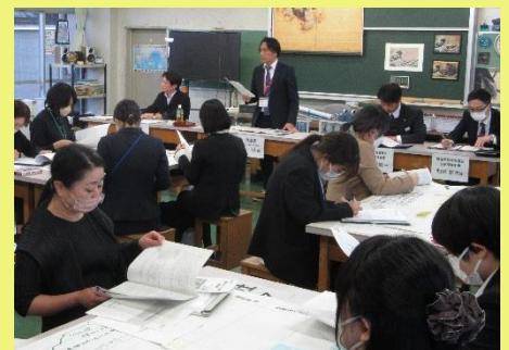
指導者によるまとめ