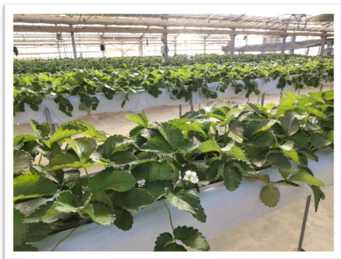
イチゴの栽培状況