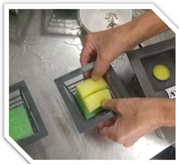
ポットの中の様子