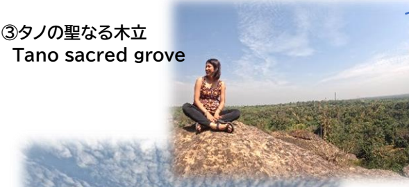
③タノの聖なる木立 Tano sacred grove