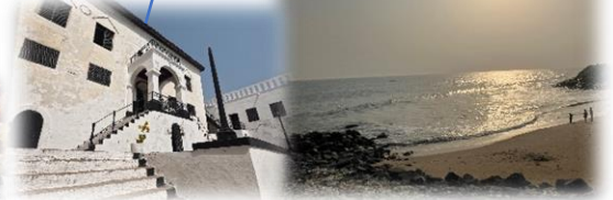
①ケープコースト城 エルミナ城