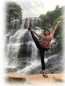
④キンタンポの滝 Kintampo Waterfalls