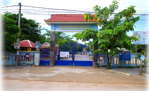
→ 配属先学校の正門

シェムリアップは観光で栄えている町なので、現在はコロナ禍の影響が強く、街中には廃墟が目立ちます。コロナ禍前は賑やかだったのだろうことを思うと寂しくなります。カンボジアでは入国規制が緩くなったこともあり、シェムリアップ内でも観光客を少しずつ見かけるようになってきました。早く元の賑わいを取り戻してほしいと願います。