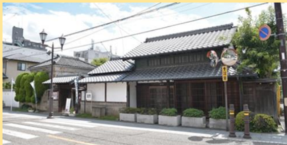
中山道地区における、にぎわいを創出する新たな交流拠点の整備（歴史民俗資料館別館等）