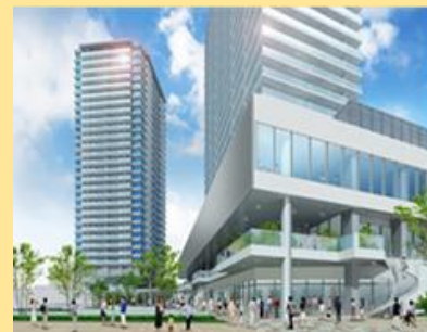
にぎわいをもたらす新たな集客拠点である駅西口地区の再開発の推進