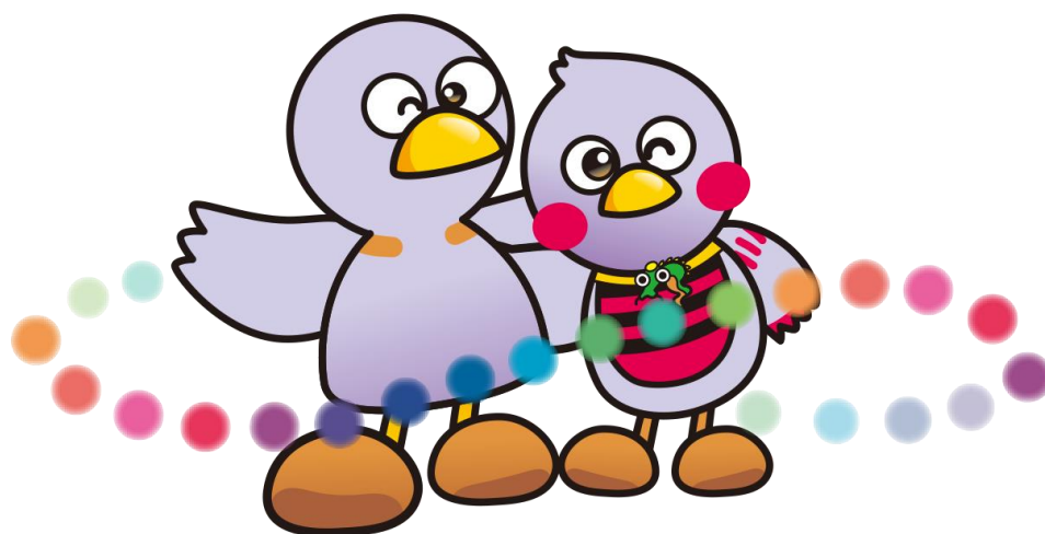
埼玉県マスコット「コバトン」「さいたまっち」