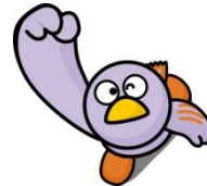
埼玉県のマスコットコバトン