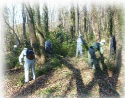
里山・平地林（狭山市）