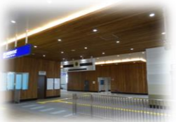
駅自由通路（幸手市）