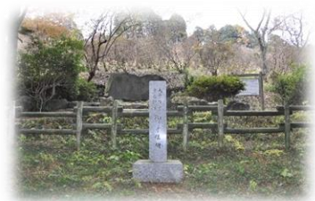
第10回全国植樹祭記念碑