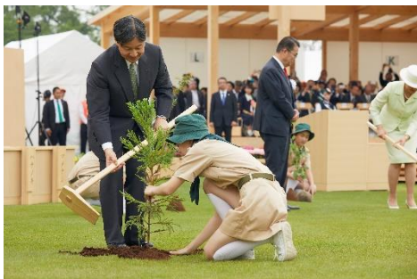
天皇陛下お手植え (第70回全国植樹祭〔愛知県〕)