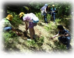
森づくり活動（越生町）