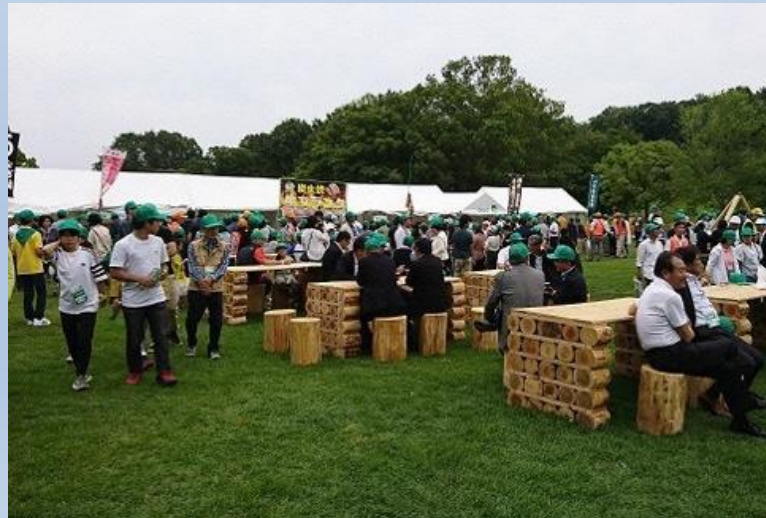
おもてなし広場の様子