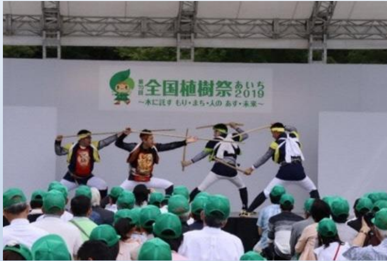
おもてなしステージ