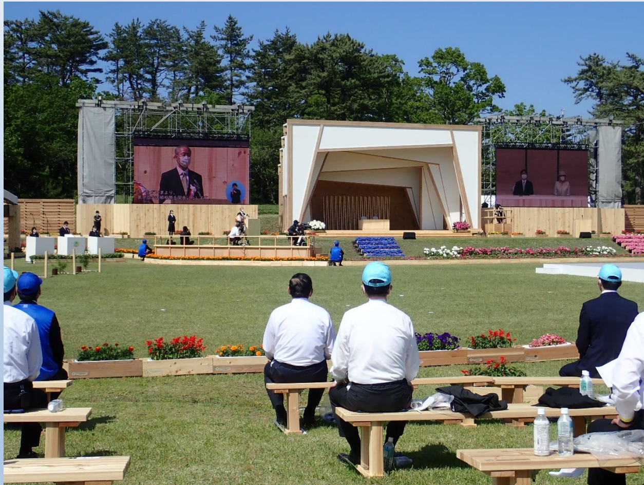
(第71回全国植樹祭島根県2021)