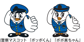
埼玉県警察マスコット「ポッポくん」「ポポ美ちゃん」