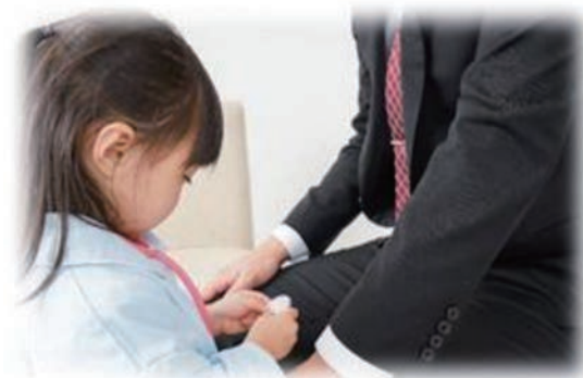
がん検診は、従業員等の家族も守る大切な検診です