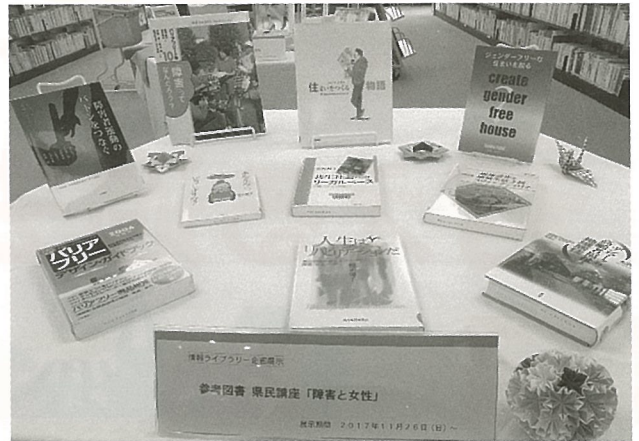
昨年の展示の様子