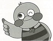
埼玉県マスコット 「さいたまっちゃん」

埼玉県では、障害者を積極的に雇用している事業所を【埼玉県障害者雇用優良事業所】として認証しています。この優良事業所の取組や事例の一部をご紹介します。