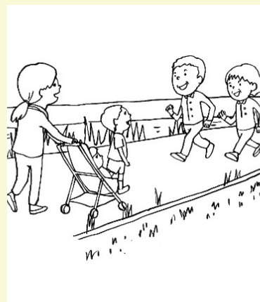
子どもからお年寄りまで、あらゆる世代が楽しめるスポットがたくさん。