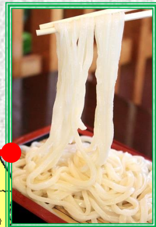
加須うどん (加須市) ピカピカの光沢、みずみずしさ、コシの強さ、のど越しの良さが特徴の加須名物手打ちうどん