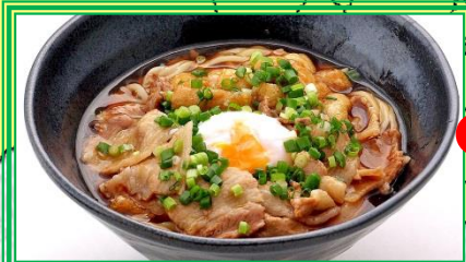
濃トロ！肉汁うどん (所沢市) とろみをついた醤油ダレの中にバラ肉をたっぷり煮込み、温泉卵をトッピングした肉汁うどん