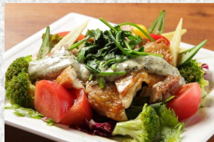
タマシャモのパリパリチキンサラダ

使用食材 ねぎ、さといも、こまつな、ほうれんそう 彩の国黒豚、彩の国タマシャモ 等