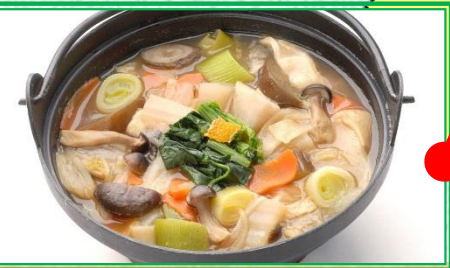
煮ぼうとう (深谷市) 深谷ネギや野菜がたっぷり入った煮込みうどん、埼玉を代表する郷土料理