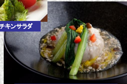
埼玉産里芋の鶏そぼろあんかけ