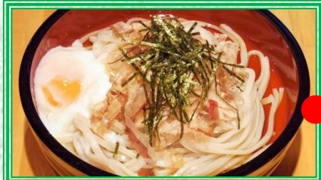
熊谷うどん (熊谷市) 熊谷産小麦を使用した地元ブランドうどん