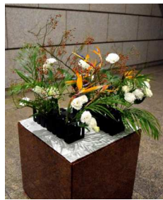
〈入口側からみた作品〉

A:台座の色も考えて黒色の花器が映えるように、また、ホールの明かりでできた影の模様がくっきり出るように、白色のシートを敷きました。また、2つある花器のうち入口玄関側のものを奥にずらし、作品がホールに入ってきた人に向くイメージで生けました。