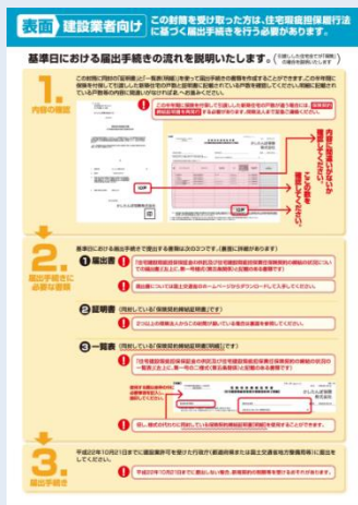
送付物① 届出手続の流れの説明資料