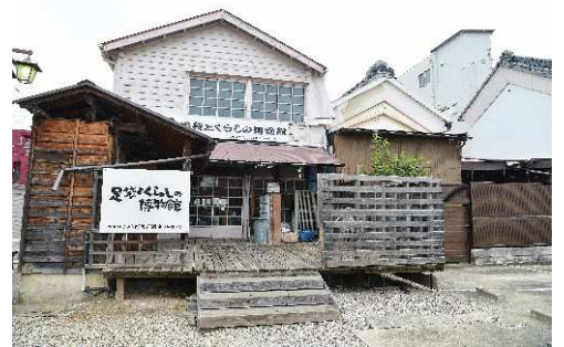
足袋とくらしの博物館