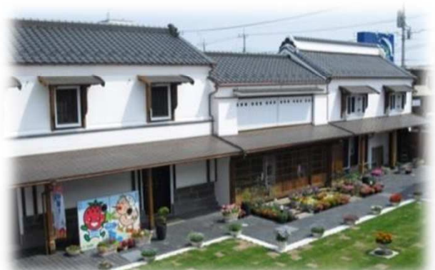
鴻巣市産業観光館「ひなの里」 人形店の蔵を利用しています

地名の由来となった「こうのとりの伝説」の伝承があります 両側は樹齢700年の「夫婦銀杏」