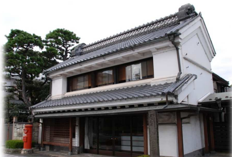
漆喰による蔵造りの店構え ひがしや (東屋田村本店)