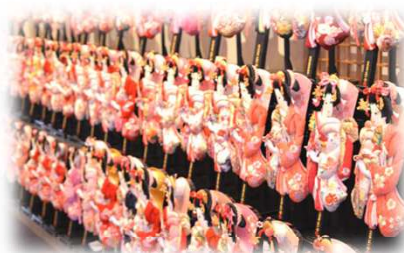
押絵羽子板(羽子板ギャラリー 匠一好)