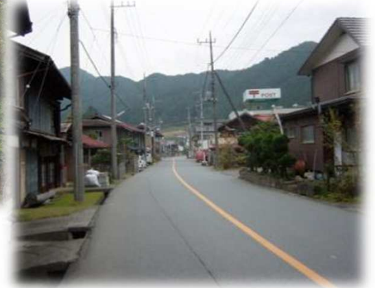
吾野宿のまちなみ