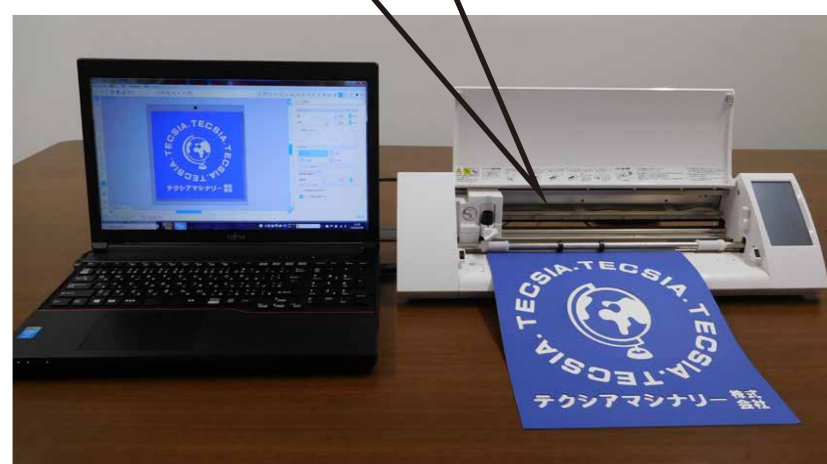
カッティングマシン