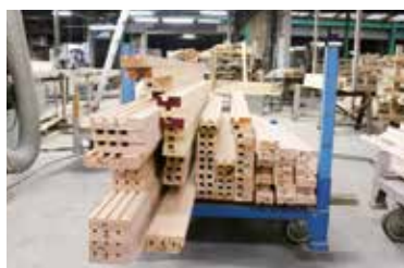
木材の仕様は複雑なため、FAX注文が多い。

外出中の営業スタッフもスマートフォンに自動転送され、内容をすぐ確認、対応が可能になったことで、お客様にも喜ばれている。また悩みだったセールスFAXは、一度番号登録すればブロックされ、スタッフのストレスも解消。無駄な紙代もかからなくなったことで、コスト削減につながった。