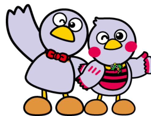
コバトン さいたまっち