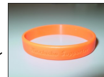
認知症サポーター養成講座受講者にお渡しする「オレンジリング」

URL: http://www.pref.saitama.lg.jp/a0609/kyaravan/supporterindex.html