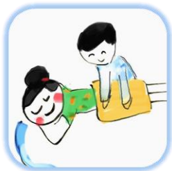
骨盤矯正 マッサージ