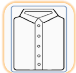
衣類・布団の クリーニング