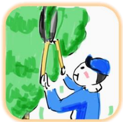
家事ヘルパー シルバー人材センター