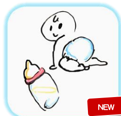
おむつ・ミルク おしりふき