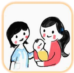
母乳マッサージ 育児相談