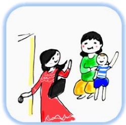
ベビーシッター 一時預かり ファミリーサポートセンター