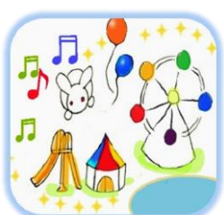
県内遊園地・動物園・プール 映画館 親子で参加したコンサート