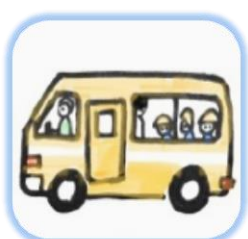
保育園・幼稚園・放課後児童クラブ等の保育施設での実費徴収金（バス代・おやつ代・延長保育代など）