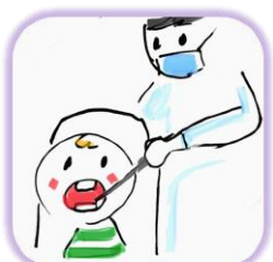
歯科フッ素塗布 任意予防接種