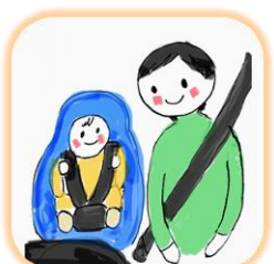
子育てタクシー （子どもと同乗した場合、一般のタクシーも可能）