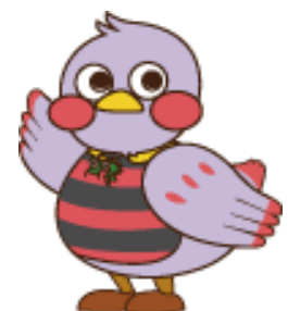
埼玉県のマスコット さいたまっち