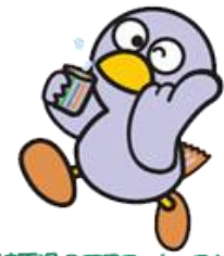
埼玉県のマスコット・コバトン