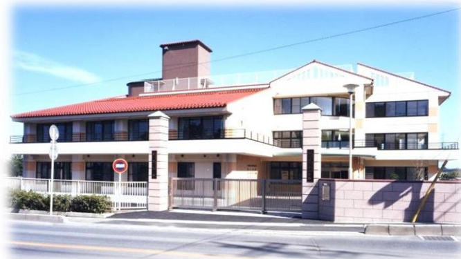
(児童発達支援センターみつばすみれ学園)