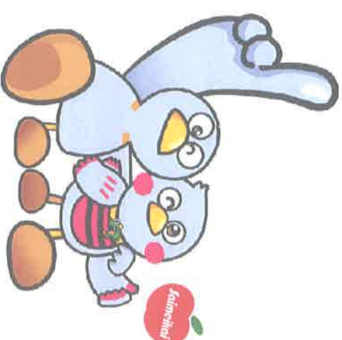
埼玉県マスコットキャラクター『さいたまっちゃん』