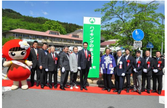
「ハイキングのまち宣言事業」に活用しました

町では、豊かな自然と資源を活かしたまちづくりに共感し、応援してもらうため、「魅力あるまちづくり寄附金」を平成26年7月に制定して、個人、法人または団体の皆さまから多くの寄附金を受け入れてきました。寄附金は、寄附した方の意向に沿って活用されますが、それぞれの目的ごとに基金として積み立てられています。