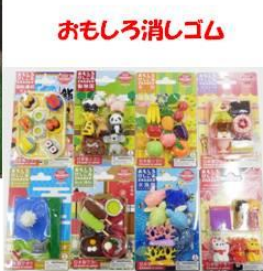
おもしろ消しゴム