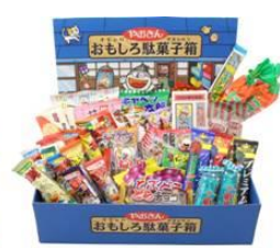
おもしろ駄菓子箱 (うまい棒等)