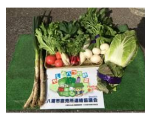
安全・安心・新鮮 八潮野菜 旬おまかせセット ～やしお八つの野菜～