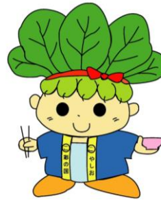
ハッピーこまちゃん®

また、市内には、製造業を中心に多種多様な業種が集積し、自社ブランド製品をお持ちの事業所や優れた技術や技能をお持ちの方も数多くいます。